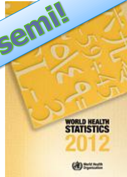
World Health Statistics 2012